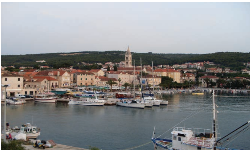
Panorama Supetra na Braču

vatske u SAD uvjeren da bi mogao nagovoriti Amerikance da posjete grad koji je poslužio kao svojevrsni predložak, ali i da ih nagovori na ulaganja u Hrvatsku. Mjesto je posjetila i ekipa HRT-a.