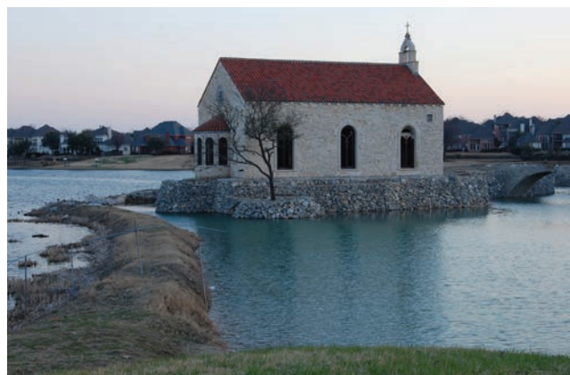
Crkvice na obali jezera