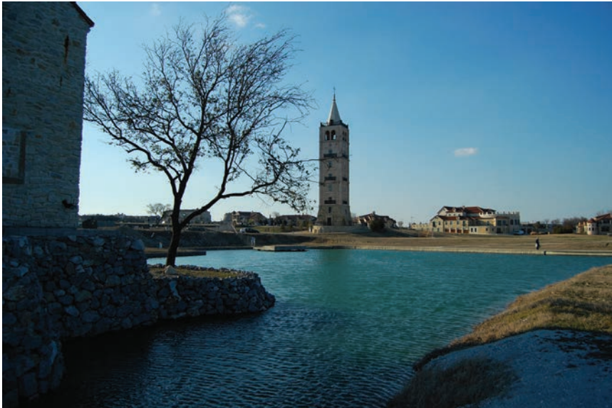
Samostojeći zvonik koji dosta sliči supetarskome