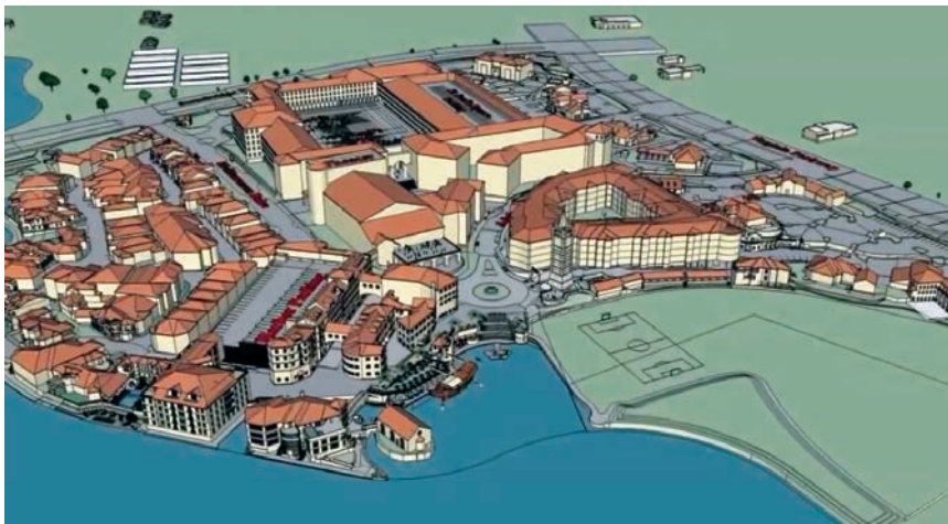
Budući izgled Adriatice s velikim poslovnim i stambenim kompleksima